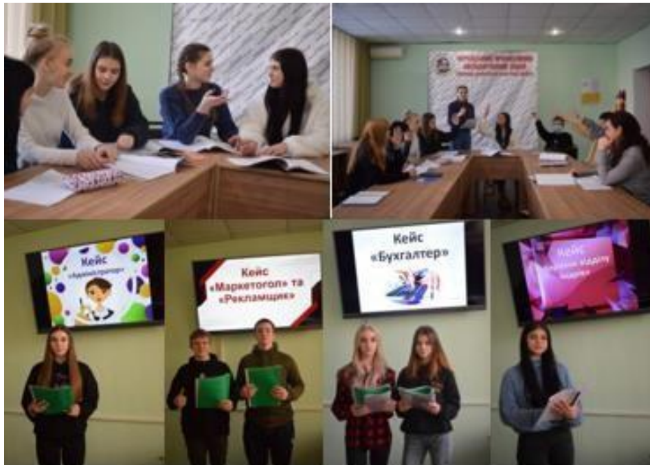
Рис. 4. Доповіді здобувачів освіти про результат роботи

Таким чином, здобувачі освіти відтворюють процес та організацію роботи на підприємстві. Це дозволяє збільшити розуміння про те наскільки важлива професія адміністратор та секретар керівника, як робота кожного працівника взаємопов'язана між собою, розкриває поняття системи процесу роботи, розширює світогляд на ці професії, а також піднімається питання ділового спілкування, конфлікти та їх вирішення, методу управління працівниками, спрацьованість, мотивація.