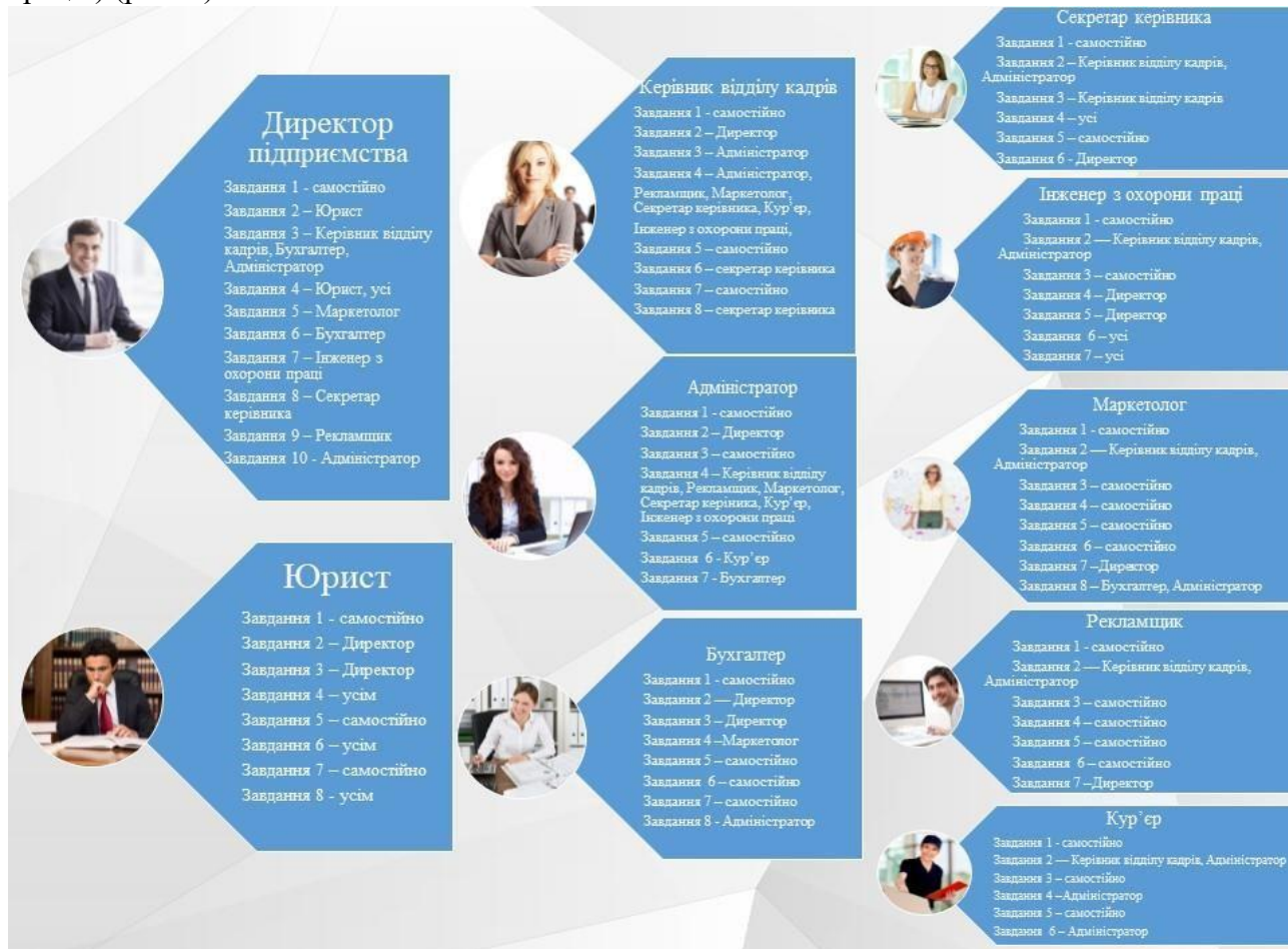
Рис. 3. Структура завдань у кейсах

Завдання в кейсах складені так, що кожна професійна роль поєднується з іншою. Наприклад, певні ідеї маркетолога та рекламщика неможливо реалізувати без обрахунків бухгалтера та узгодження директора, або до роботи з кейсами ніхто не може приступити без зарахування в штат підприємства (завдання «Керівник відділу кадрів») та проходження інструктажу з охорони праці та безпеки життєдіяльності (завдання «Інженер з охорони праці») (рис. 3).